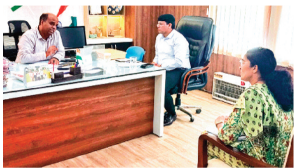
हरिभूमि न्यूज ▶ राजगढ़

जिले के वनक्षेत्रों में अवैध कटाई, वनभूमि पर अतिक्रमण की रोकथाम, वनक्षेत्र एवं राजस्व क्षेत्र में अवैध उत्खनन, परिवहन, भंडारण से संबंधित प्रकरणों के संकलन एवं समीक्षा किए जाने हेतु गुरुवार को कलेक्टर डॉ. गिरीश कुमार मिश्रा की अध्यक्षता में वन विभाग एवं खनिज विभाग की संयुक्त टास्क फोर्स समिति की बैठक आयोजित की गई। बैठक में कलेक्टर डॉ. मिश्रा ने