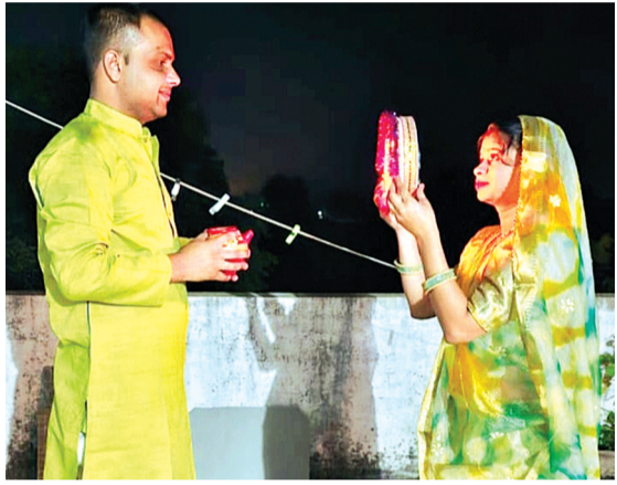
हरिभूमि न्यूज | नलखेड़ा

करवा चौथ का पर्व नगर सहित अंचल में उत्साह व श्रद्धा के साथ मनाया गया। सुहागिन महिलाओं ने पति की लंबी उम्र और दीर्घायु के लिए प्रार्थना के लिए निर्जला व्रत रखकर देर शाम मेहंदी लगे हाथों के साथ सोलह श्रृंगार कर सज सवकर एक जगह एकत्रित हुईं तथा भगवान शिव व माता पार्वती की पूजा-अर्चना कर करवा चौथ व्रत की कथा सामूहिक रूप से सुनी गई। रात्रि में चंद्रमा को अर्घ्य देकर अपने पतियों के हाथों से व्रत खोला।