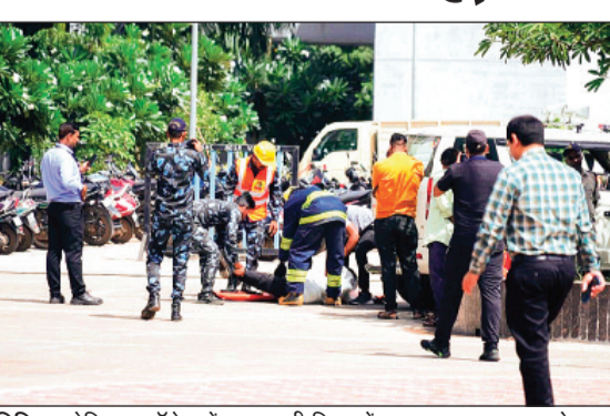
विद्विशा। मेडिकल कॉलेज में आपदा की स्थिति में बचाव का अभ्यास करते हुए।