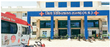
हरिभूमि न्यूज ▶ ब्यावरा

जिला अस्पताल के सीएमएचओ ऑफिस में बाबूओं के किस्से आम हो चले हैं यहां पर अधिकारियों को बाबूओं का हाथ की कठपुतली कहा जाता है और इसका प्रमाण देखने में मिलता भी है और संबंधित अधिकारी आंख मूंदकर बस हस्ताक्षर कर देते हैं। ऐसा ही एक और मामला प्रकाश में आया है जहां पर कलेक्टर के आदेश के बाद सामाजिक न्याय एवं दिव्यांगजन सशक्तिकरण विभाग मद्र के आदेश के