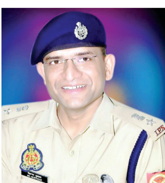
मूल्यांकन में मुख्यमंत्री पोर्टल, जनसुनवाई, समाधान दिवस आदि पर प्राप्त शिकायतों का उचित, गुणवत्तापूर्ण एवं समयबद्ध निस्तारण